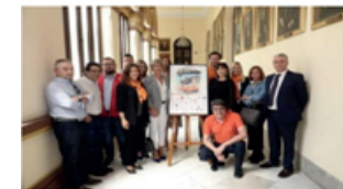
Málaga - El Museo Automovilístico acoge el domingo su Caravana Solidaria a favor del pueblo sirio.

El Museo Automovilístico y de la Moda de Málaga ha presentado este jueves en la Sala de Prensa del Ayuntamiento la IV edición de su conocida Caravana Solidaria, que tendrá lugar el próximo domingo 12 de mayo a partir de las 11.00 en los jardines de la Tabacalera, a favor del pueblo sirio, en colaboración de Cruz Roja Española.