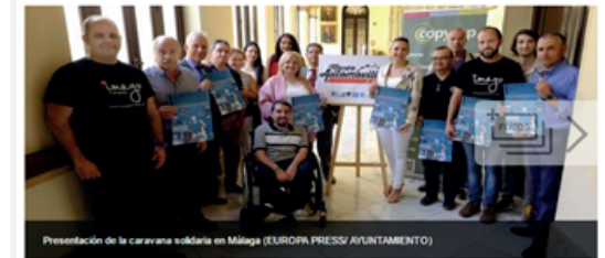
Presentación de la caravana solidaria en Málaga

Málaga acoge este domingo la primera caravana solidaria, en la que participarán unos 40 vehículos y que persigue el objetivo de recaudar fondos para la Asociación Malagueña de Espina Bífida y el Centro Ocupacional Serranía de Chumiana.