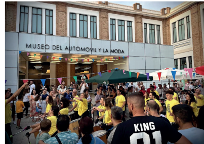
El evento se celebró el sábado en la plaza de la Tabacalera. Sur

La novena edición de la Caravana Solidaria duplica la cifra de años anteriores y destina todo el beneficio a la asociación mijeña Adimi