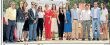
Gran semana solidaria en Málaga.

Málaga. El Museo Automovilístico y de la Moda ha acogido esta mañana la presentación de su primera Semana Solidaria que se celebrará del 20 al 28 de mayo y que finalizará con una caravana de coches de época que ya se llevó a cabo el pasado año.