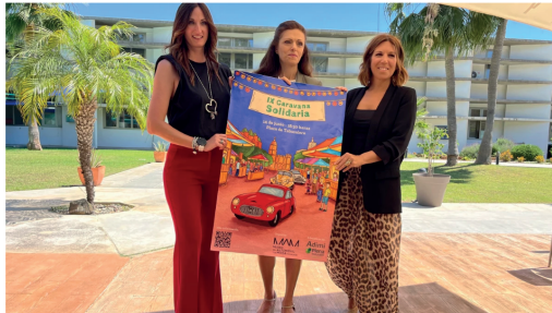
El Museo del Automóvil y la Moda prepara ya la IX Caravana Solidaria a favor de la Asociación para personas con Discapacidad de Mijas - Museo del Automóvil y la Moda

Esta cita anual con la solidaridad, organizada por el Museo del Automóvil y la Moda de Málaga, tendrá lugar el próximo sábado 14 de junio a partir de las 18:30 horas