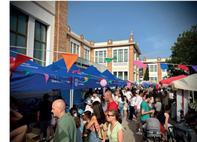
IX Caravana Solidaria del MAM

El espacio museístico ha conseguido la colaboración de más de 100 empresas y entidades de España.