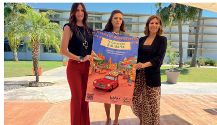
Presentación de la Caravana Solidaria a favor de Asociación para Personas con Discapacidad de Mijas que será en el Museo del Automóvil de Málaga el 14 de junio.

En esta ocasión destinará todos los beneficios recaudados íntegramente a la Asociación para Personas con Discapacidad de Mijas (Adimi)