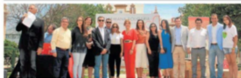
Presentación de la Semana Solidaria en Málaga.