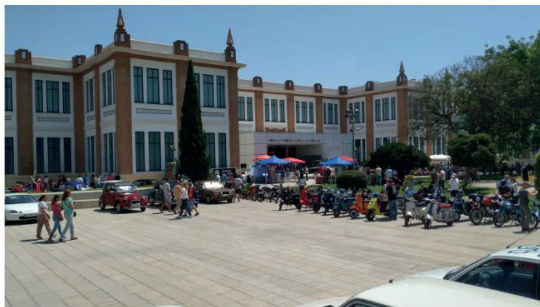
El ambiente de la Caravana Solidaria en el exterior del Museo.