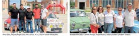
Caravana de coches de época en Málaga.